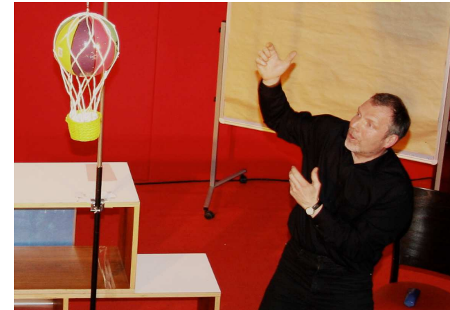
Orientierungsnöte – der Ballonfahrer weiß nicht mehr wo er ist. Nun sollen die Leute unter ihm sein Problem lösen. Welche Rolle mag er in der Fusion haben?