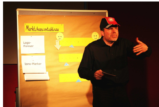
Fusionsideen – das Publikum hilft bei der Bewertung der Marktchancen.