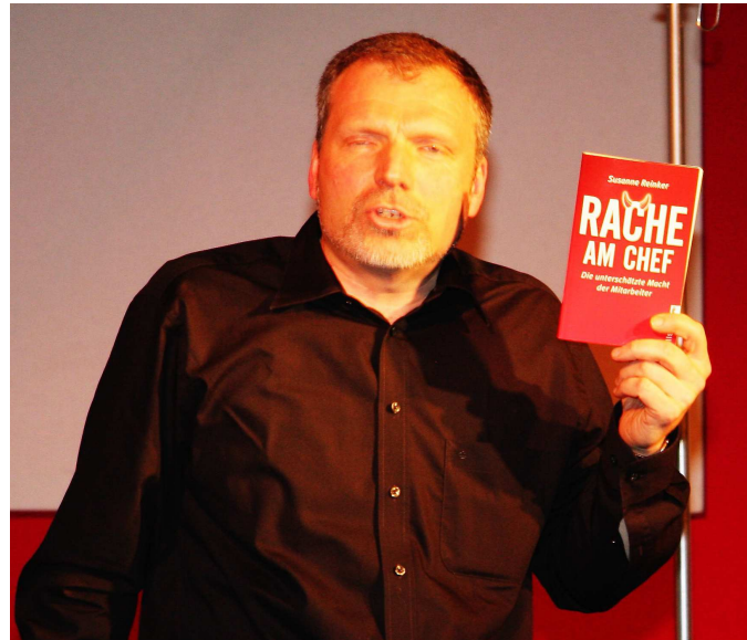
Racheprojekt eines Fusionsverlierers – Anregungen gibt's genug...