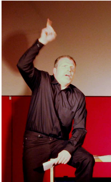
Feierabend – hat der Sohn endlich den selbstgesteuerten Qualifizierungsprozess „Vokabeln“ abgeschlossen?