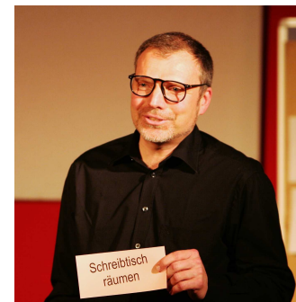
Der Fusionsberater weiß, welche Wirkstoffe in die InFusionslösung gehören und setzt die Schlusspunkte.